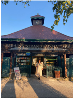
EIN STRANDBAD MIT NOSTALGIE-FAKTOR