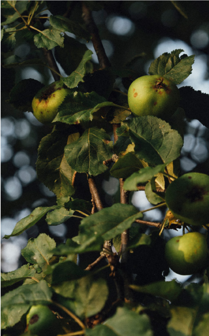
Unser Apfelbaum im Juli.