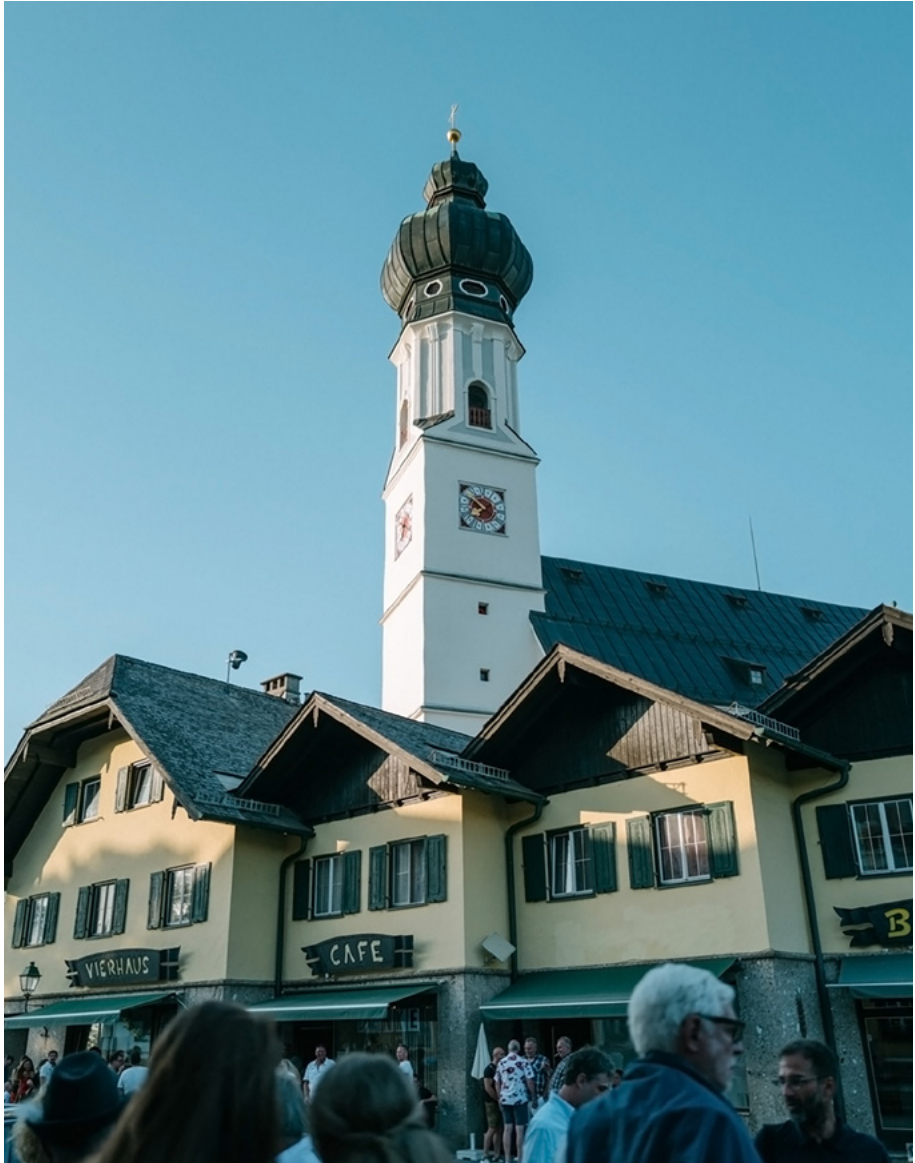
Belebter Dorfplatz Obertrum am See mit Blick auf das Vierhaus.